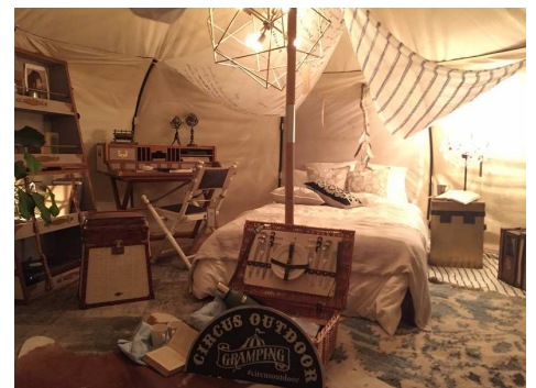
<グランピングイメージ>