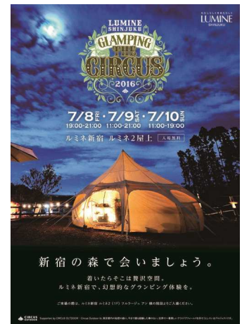
<メインビジュアル>

イベント中、ルミネ新宿ルミネ2の屋上が、“森”に変貌。新宿駅の上に、「サーカスアウトドア」がプロデュースする秘密の森が3日間限定で出現し、非日常空間を演出します。煌びやかなテントが立てられた幻想的な空間のなかで、クラフトビールや夏らしいフード、アーティスト LIVE、各種ワークショップなど、都心にいながら、グランピング体験をお楽しみいただけます。