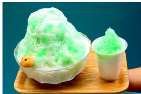
ゾウガメのように大きなメガサイズのかき氷はシェアにぴったり