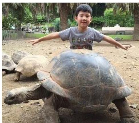
アルダブラゾウガメ