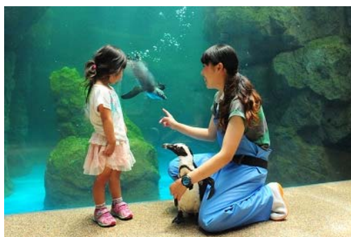
ペンギンたちがすぐそばにやってくる「ハロー！ペンギン」