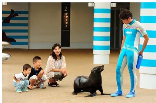
初開催！オットセイのお散歩タイム「ぶらりオットセイ」

ミナミアメリカオットセイやケープペンギンが展示エリアを飛び出しお客さまのすぐそばまでやってくるお散歩タイムを開催します。ガラス越しではない間近で息づかいまで感じることで、愛らしい姿や仕草にいきものたちの魅力をより体感することができます。