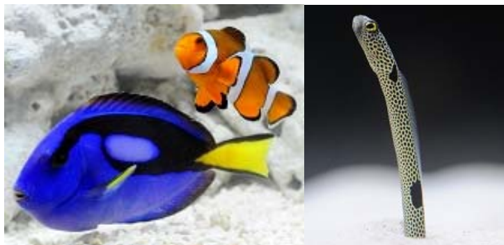
館長と一緒に人気のいきものをじっくり観察しよう

さんご礁のいきものエリアでは、普段は入れない飼育スタッフ専用ヤードに入り、人気のいきものカクレクマノミやナンヨウハギ、チンアナゴにごはんをあげて食べる姿を観察することができる「館長のおさかな教室」を開催します。館長に直接質問することができ、夏休みの宿題にもぴったりです。