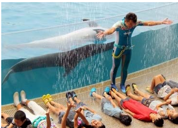
イルカと一緒にずぶぬれになって遊べる新感覚の夏限定プログラム

イルカスタジアムの屋根に設置した幅約 15mの巨大ウォーターカーテンから次々と形を変えながら流れ落ちる水とイルカがコラボレーションし、イルカの近くで水しぶきを浴びながらずぶぬれになって楽しめる、これまでにない新感覚のウォーターアトラクションプログラムです。「スーパースプラッシュ!!エリア」では、あおむけのポーズを見せるイルカたちと同じポーズで寝転ぶと上から巨大ウォーターカーテンの水やイルカのいたずらによる水しぶきが落ちてくるなど、夏の暑さを吹き飛ばす水遊びをイルカと一緒に楽しんでいただけます。