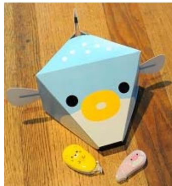
海のいきものぼうしをかぶって水族館を楽しもう

ココヨのテープのり「ドットライナー」を使って海のいきものたちの帽子を作るワークショップ。京都水族館で人気のイルカやペンギン、フグに加えてゾウガメの帽子も登場！かぶって歩けばより水族館を楽しめます。またタイアップ記念として、海のいきものをモチーフにした限定デザインの「ドットライナー AQUA」を各日先着40名さまにプレゼントします。