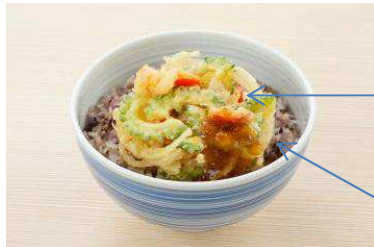
「夏越ごはん」イメージ

「夏越ごはん」は、「夏越の祓」の茅の輪の由来となった、蘇民将来が素盞鳴尊(すさのおのみこと)を「粟飯」でもてなしたという伝承にならった「粟」、邪気を祓う「豆」などの雑穀の入ったごはんに、茅の輪をイメージした旬の夏野菜の丸いかき揚げをのせ、百邪を防ぐといわれるしょうがを効かせたさっぱりおろしだれをかけたごはんです。