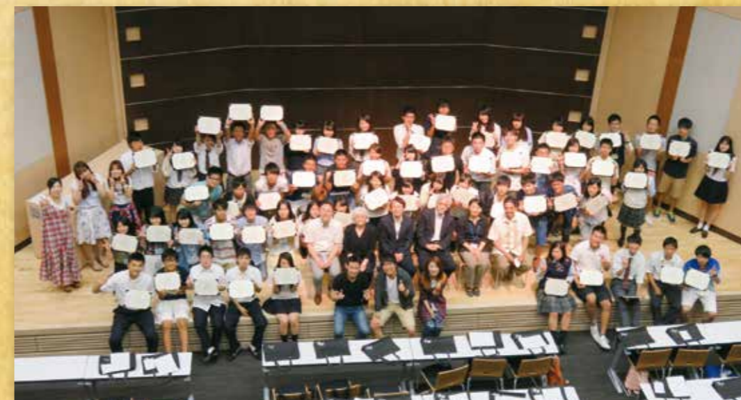
2015 年度 受講生集合写真