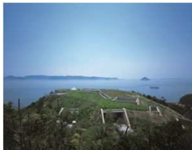
地中美術館