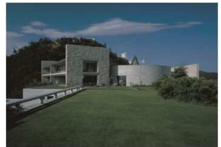
ベネッセハウス

当社は本企画をはじめとして、「その先の、オフィスへ」をスローガンに、既存のオフィス事業の概念を超えた、新しい付加価値の提供を行っております。