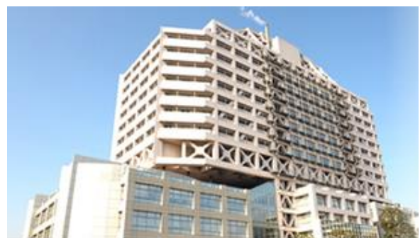
川崎市立 川崎病院

発注者：川崎市立 川崎病院 業務場所：川崎市川崎区新川通12-1 契約期間：2016年4月1日～2019年3月31日