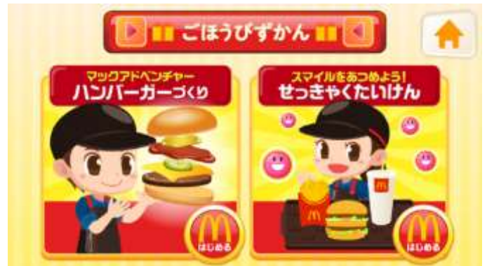
【ゲーム版「マックアドベンチャー」ゲーム画面】

また、このゲーム版「マックアドベンチャー」は同日4月22日(金)から、株式会社キッズスターの提供する知育アプリ「なりきり!!ごっこランド」でもアプリゲームとしても登場いたします。お子様がゲームを通して、気軽にマクドナルドのお仕事体験プログラムを体験していただくことで、お子様の好奇心を育てていただければと存じます。