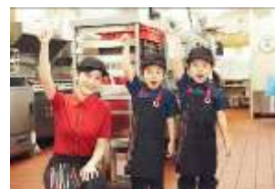
ユニフォームに着替え