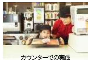
カウンターでの実践