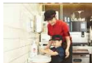
マクドナルドの手洗い