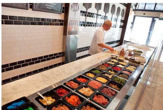
▲店内、トッピングレーン

800° DEGREES NEAPOLITAN PIZZERIA は、本格ナポリピッツァをカウンターサービスでカジュアルに楽しめるレストランで、シェフ兼創設者のアンソニー・キャロン氏が、アメリカで 2012 年にオープンしました。西海岸を中心としたカスタマイズ業態ブームの牽引者の一人とも言われており、海外からのオファーも相次いでいる急成長ブランドです。2012 年 1 月にオープンしたウエストウッドビレッジ店では、1 日平均で 800~1,000 枚のピッツァを販売しており、大反響を呼び、オーダーメイドピッツァブームの火付け役に。