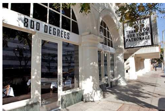
▲ウエストウッドビレッジ店