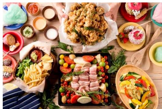
<提供メニュー(イメージ)>