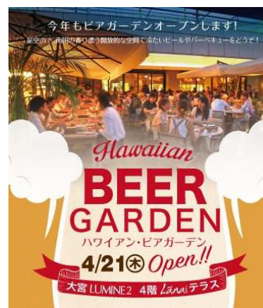
<ポスタービジュアル>