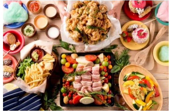
<提供メニュー(イメージ)>

ルミネ池袋 では、NYのトレンドを散りばめたBBQフロアと、フードスタンドが並ぶコミュニティフロアの2つのフロアからなる新感覚のBBQビアガーデン「 THE ROOFTOP BBQ BEER GARDEN (ザ ルーフトップ バーベキュー ビアガーデン)」を展開します。BBQフロアでは、NYで昔から愛されている定番のフードカルチャーを散りばめたメニューを取り揃えています。さらに全てのコースに、自分でパンズを焼き上げてサンドする、セルフメイドバーガーをご用意します。