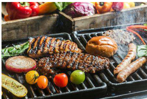
<提供メニュー(イメージ)>

・「GOOD MEALS SHOP(グッド ミールズ ショップ)」: ハンドメイドと自然素材にこだわったお食事やお酒、アイスクャンディーなどを提供するレストラン。