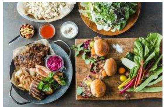
<提供メニュー(イメージ)>

NYスタイルのバーベキューを楽しめる「 THE ROOFTOP BBQ BEER GARDEN (ザ ルーフトップ バーベキュー ビアガーデン)」と、フードスタンドが立ち並ぶ「 THE ROOFTOP FLEA (ザ ルーフトップ フリー)」の2つのエリアからなるバーベキュービアガーデン「 THE ROOFTOP BBQ BEER GARDEN 」がオープン。