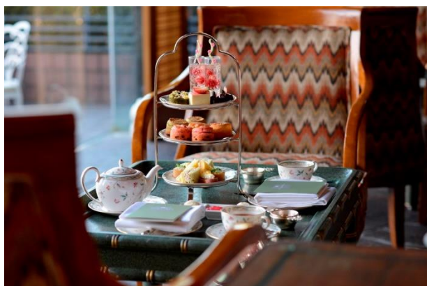
桜アフタヌーンティー