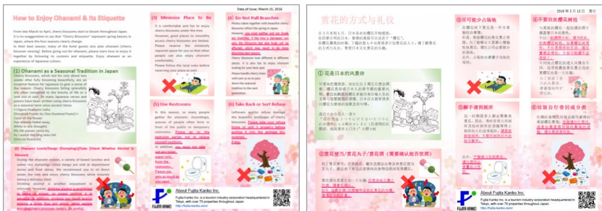
当社で作成したお花見の楽しみ方とマナーを紹介するリーフレット ※英語版/中国語版を用意

日本文化の楽しみ方を知っていただくことにより訪日リピーターの獲得に繋げ、観光立国の実現に向けて貢献してまいります。