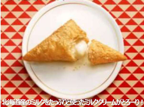
北海道ミルクパイ

また、3月26日（土）の北海道新幹線の開業を記念し、「北海道」の10店舗とJR東京駅店で、3月25日（金）より先行販売を開始いたします。（詳細は4ページ参照）