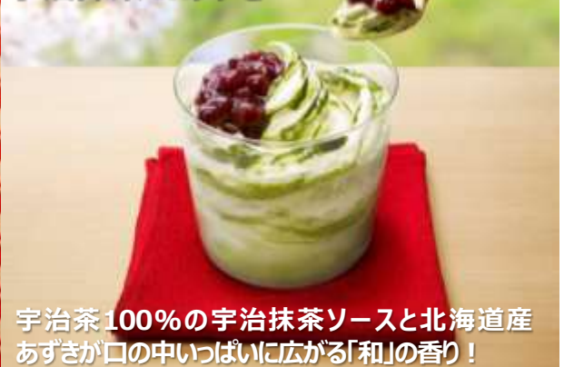
マックフルーリー 宇治抹茶&あずき

宇治茶100%の宇治抹茶ソースと北海道産あずきが口の中いっぱい広がる「和」の香り！