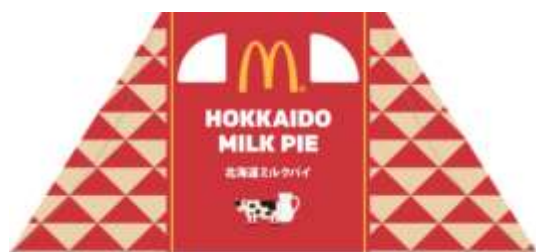
<通常販売時のパッケージ>

「北海道ミルクパイ」の先行販売では、北海道新幹線イメージカラー「彩香パープル」を採用した、限定パッケージで販売いたします。「彩香パープル」は、北海道新幹線の中央の帯に使用されている色で、ライラック、ルピナス、ラベンダーを想起させます。