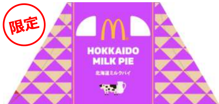
<「彩香パープル」限定パッケージ>