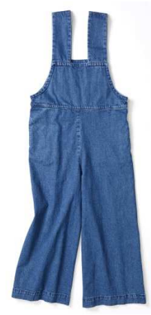
【野崎萌香さんコラボ商品】 ミスティック (4F) 「サロベット」9,800 円 (税抜)