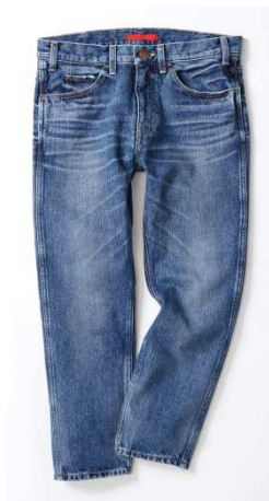
【RED CARD 別注商品】 ビームス (1F) 「RED CARD BESTFRIENDS」 20,520 円 (税抜)