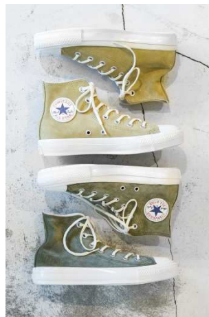
【コンバース別注商品】 ビューティ & ユース ユナイテッドアローズ (B1) 「スエードハイカットスニーカー」 13,500 円 (税抜)