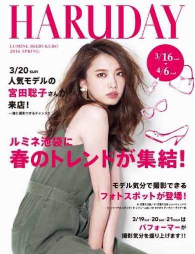
&lt;ポスタービジュアル&gt;

この春のトレンドが集結する3週間、ぜひルミネ池袋へ春を感じに遊びにいらしてください。