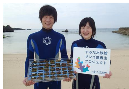
2016年2月に39株のサンゴの移植を行いました