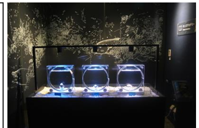
サンゴアカデミー

展示内容：サンゴの砂やサンゴ礫に触れたり、サンゴを近くでじっくりと観察しながら、サンゴについて楽しく学べる展示です。イベント開催期間中は、「みんなで作ろう！1・2・サンゴ」で集まったポリプシールの数を随時更新して表示します。