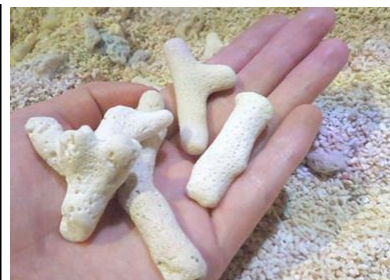
「サンゴの日 サンゴ証」のサンゴ

開催日：2016年3月5日(土) 配布時間：9時00分～ 配布場所：エントランス改札口 開催内容：3月5日「サンゴの日」に来館したお客さま先着3,535名に、「サンゴの日 サンゴ証」としてサンゴ礫(れき)*をプレゼントします。 ※サンゴ礫はサンゴの外骨格です。