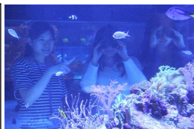
「みるみるサンゴ」イメージ

開催日：2016年3月5日(土)～5月8日(日)中の毎週金曜日 ※3月11日(金)は開催なし 開催時間：各日19時30分～(約20分間) 開催場所：6階 「サンゴ礁」ゾーン 参加方法：当日受付 参加対象：18歳以上 参加定員：各回3組6名 開催内容：飼育スタッフと一緒に、サンゴの水槽を双眼鏡を使って観察するプログラムです。視界に水槽内の景色が広がり、まるでサンゴの海に潜ったように感じられます。サンゴの生き生きとした姿を間近で観察し、魚や貝たちとの関わりを知ること、いのちを育むサンゴの役割を実感します。