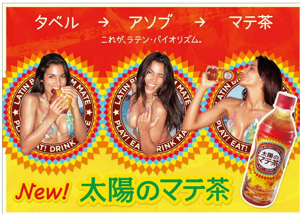
「太陽のマテ茶」キービジュアル