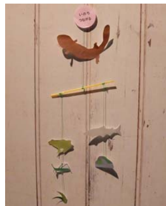
バランスを取りながらゆらゆらと動く『“いのちつながる”いきものモビール』※イメージ