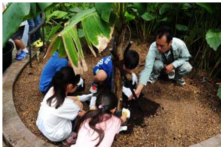
第1回連携ワークショップ 『ゾウさん、オットセイさんのウンチでバナナを育てる』 実施の様子

3園館包括交流連携協定 連携ワークショップでは、これまでに京都市動物園のゾウと京都水族館のオットセイのウンチから肥料ができることや植物に対する肥料の役割について学ぶ『ゾウさん、オットセイさんのウンチでバナナを育てる』や、いきもの全般に関する質問や相談にお答えする『夏休みの宿題いきもの相談会』、「いきものの大きさ」をテーマにした体験学習プログラムを各施設が実施した『いきものスケール』など、3園館が専門性を活かした連携ワークショップを開催しました。