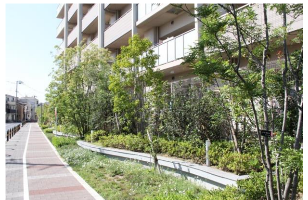
新駅へ繋がる沿道景観

「茨木未来の街」の開発総面積は約 23,625 m 2 （甲子園球場のグラウンド約 1.8 倍）。広大な敷地に住宅棟を 3 街区に分けて建設、新駅までのアクセス道路および公園や駅前広場を整備します。JR 西日本の新駅と茨木市の都市計画に基づく新駅周辺共同開発事業は、茨木市が推し進める 5 大プロジェクトの一つです。