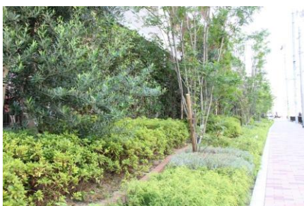
緑視効果を高めた植栽帯