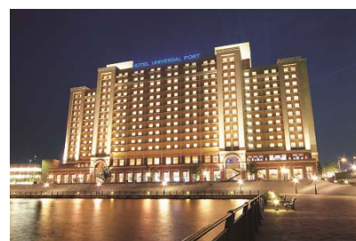
ホテル ユニバーサル ポート