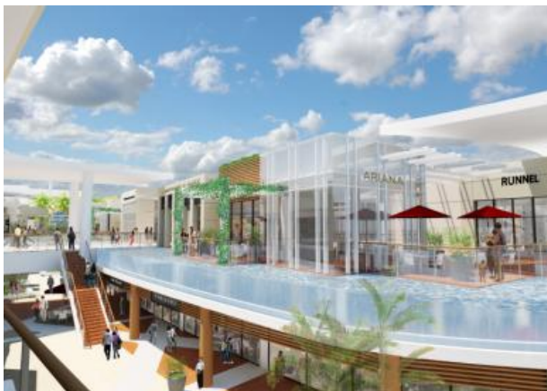
オープンモール 2 階 水上レストラン