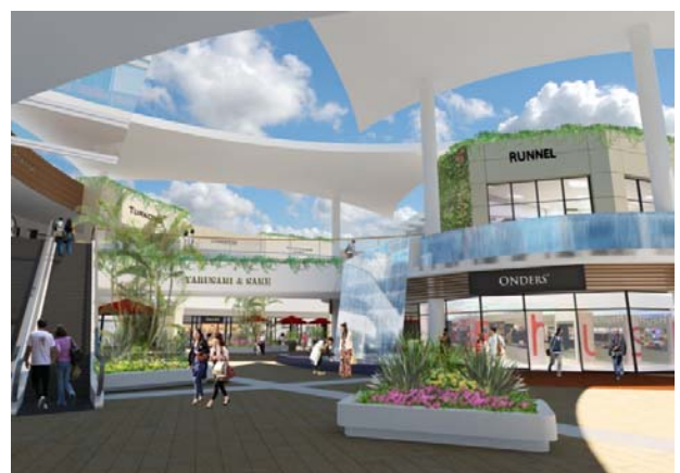
オープンモール館内