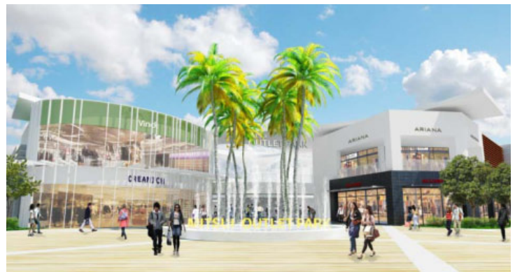
西口(ウエストゲート)