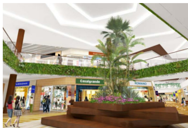
エンクローズドモール 1階