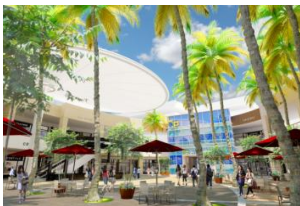
オープンモール 1階大型広場南口