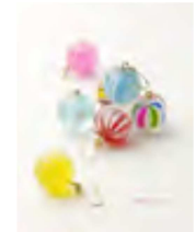
「飴アクセサリー」イメージ

ルミネエスト新宿 では、「にっぽんの飴プロジェクト」と題し、本物の飴を樹脂でコーティングしてつくった飴アクセサリーを販売します。ひと粒ひと粒が輝くカラフルでキュートな飴アクセサリーをお楽しみください。