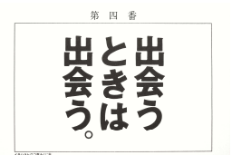
「イチハラヒロコ恋みくじ」イメージ

その他、 ルミネ横浜 では、10月26日(月)にリニューアルした書店「有隣堂」とコラボした箱根の魅力の発信、 ルミネ立川 では、立川発のレザーハンドメイドブランド「OJAGA DESIGN」の期間限定ショップのオープン、 ルミネ北千住 では、福島県の繭玉を使った干支飾りづくりのワークショップ、 ルミネ町田 では、「東北グランマ」が手作りしたお守りの販売、 ルミネ荻窪 では、九谷焼の転写技術により、シールで絵付けを体験できるワークショップ、 ルミネ大宮 では、岩手のセレクトショップ「5858」の期間限定ショップのオープン、 ルミネ藤沢 では、湘南唯一の酒蔵「熊澤酒造」の提案する地元根差した食文化の提案、 大船ルミネウイング では、“各地のいいもの”の販売など、ルミネ各館でさまざまな催事やワークショップを多数開催予定です。