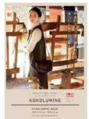
メインビジュアル