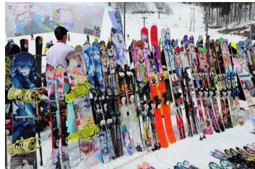
痛板ゲレンデジャックオフ