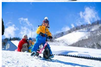
新スノーアクティビティエリア 「TAKEKO パーク」