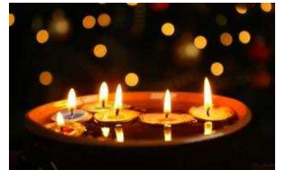
&lt;ルミネ池袋ライトダウンクリスマスイメージ&gt;