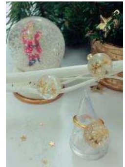
&lt;ルミネ横浜ワークショップイメージ&gt;