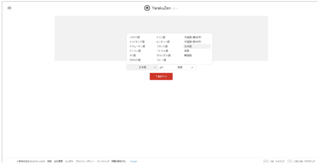
【ヤラクゼンのトップ画面】禅(ぜん)の精神に基づいた、シンプルで分かりやすいユーザーインターフェース。