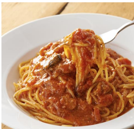
トマトとニンニクのスパゲティ

イタリアのマンマの味を思い出させるこの味を求めて、3世代で通うファンもいるほどの、40年以上愛されている看板メニューをぜひ堪能ください。