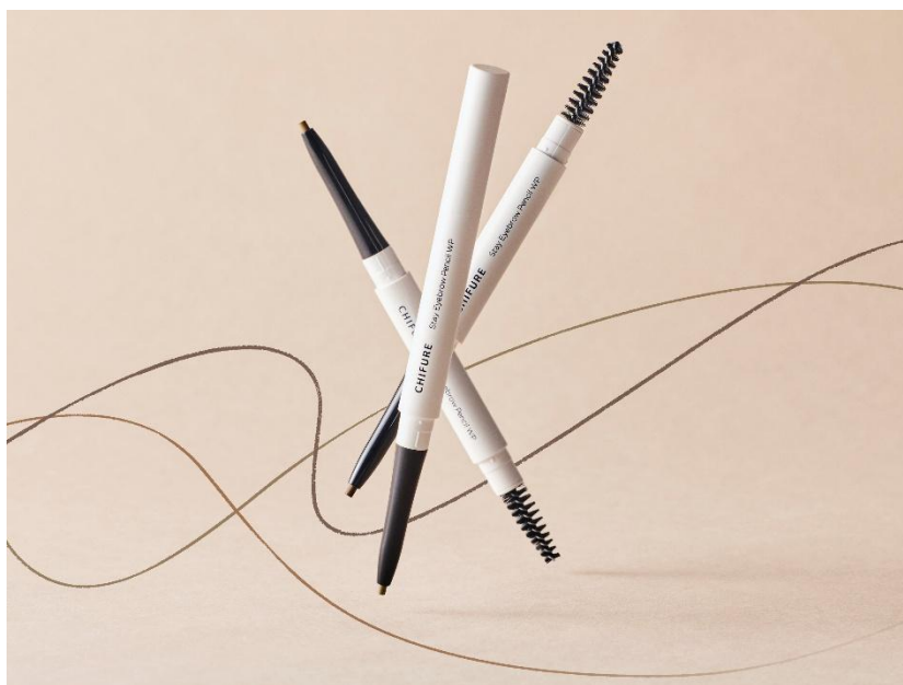
『ちふれ ステイ アイブロー ペンシル WP』