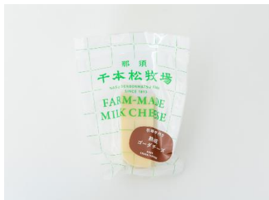
1) 牧場手作り熟成ゴーダチーズ (ACA 選出・JCQM 登録対象)

「牧場手作り熟成ゴーダチーズ」「牧場手作りリコッタチーズ」「牧場手作り焼いて食べるミルクチーズ」の3品が、全国チーズ鑑評会 2026 において、国際鑑評基準「ICES | International Cheese Evaluation Standard」に基づく専門評価を受け、20 点満点中 14 点以上の高い評価水準に達し、JCQM (JC クオリティマーク) 登録対象になりました。