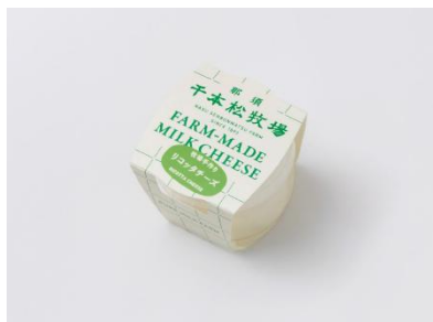
2) 牧場手作りリコッタチーズ (JCQM 登録対象)