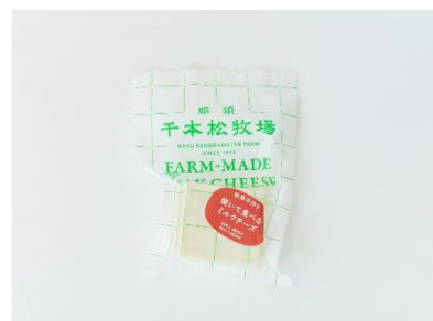
3) 牧場手作り焼いて食べるミルクチーズ (JCQM 登録対象)

那須千本松牧場は、土づくり、牧草栽培、牛の飼育、乳製品づくりまでを大切にしている循環型酪農を実践しており、今回の選出・評価を機に、那須塩原の自然と酪農を背景にした牧場発のチーズづくりを、より多くの方にお届けしてまいります。