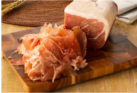
切り出しハモンセラーノ (イメージ) 913円