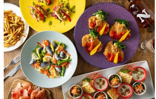
各種パーティーコース (イメージ) 2時間飲み放題、投げ放題付き 4,400円～