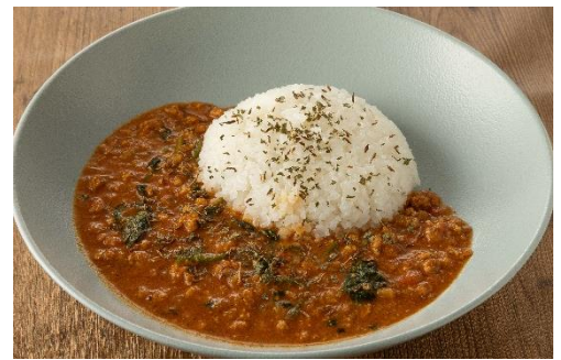
REGALO特製! 本格スパイスカレー 1,155円