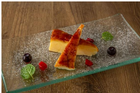
花畑牧場のクリームカタラーナ 583円