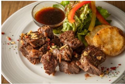
アンガス牛サガリのサイコロステーキ 1,859円