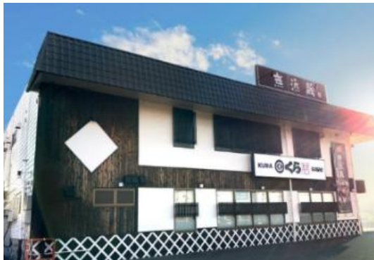
泉北店(大阪府堺市)