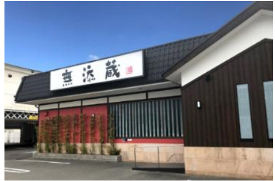
北花田店(大阪府堺市)