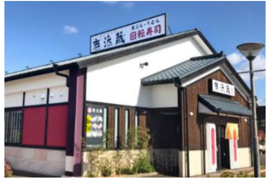
紀伊川辺店(和歌山県和歌山市)