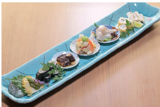
夏の旬魚肴盛り合わせ 2,780 円 ※蒸しあわび・いわし薬味巻・たこ柔らか煮・たちうお南蛮・ すずき昆布・はも梅しそ天・あなごの一夜干し