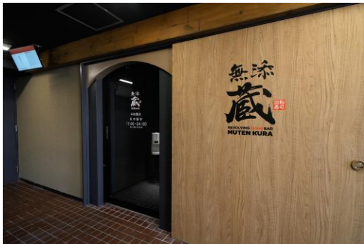
中目黒店(東京都目黒区)