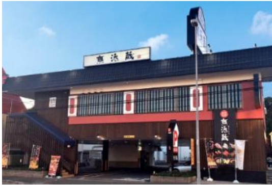
伊丹昆陽店(兵庫県伊丹市)