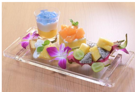
寿司屋のアフターヌーンティー(夏のフルーツパラダイス) 1,500 円 ※夏のジュエリーカップ・パイナップルココパウンドケーキ・ とろけるメロンショートケーキ・ドラゴンフルーツカップ