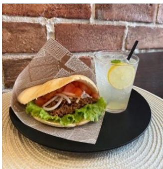
タコス風ピタパンサンド