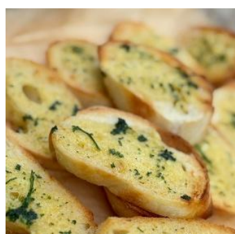
ガーリックトースト