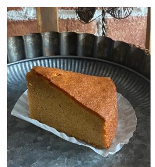
キャラメルケーキ