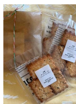
チーズペッパークッキー