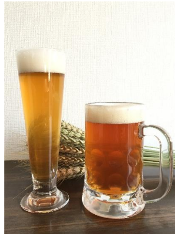
南横浜ビール研究所