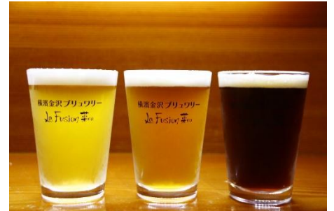
横濱金沢ブリュワリー