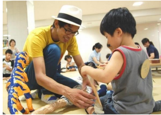
▲新聞紙×ガムテープでミッドタウンザウルスを作ろう！ 制作イメージ

新聞紙とガムテープを使って立体作品をつくるアーティストワークショップをはじめ、今回は宿泊者以外でも参加できるザ・リッツ・カールトン東京でのホテルスタッフ体験(1日1組限定)が登場します。また東京ミッドタウン・デザインハブのキッズワークショップ、館内店舗によるオリジナルアイテム制作など、アート、デザイン、仕事体験まで幅広いラインナップをご用意しました。