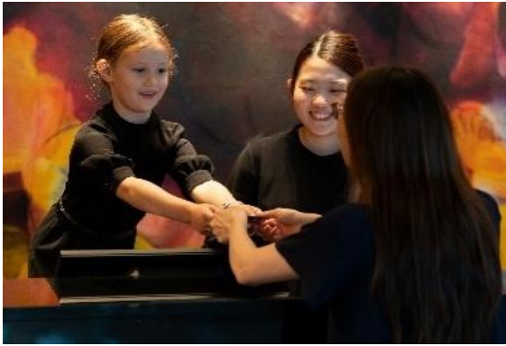
▲ザ・リッツ・カールトン東京 ホテルスタッフ体験 イメージ

今年は、夏休み期間のおでかけ先や自由研究のテーマを探すご家族に向けて、涼しい館内で親子一緒に楽しめるワークショップを拡充し、20種類を超える多彩なプログラムを展開します。