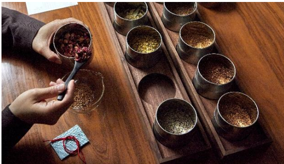
▲薫玉堂 調香体験イメージ

今夏は猛暑が予想されるなか、涼しい館内でアートやデザイン、クラフト、食文化に触れながら学びや創作を楽しむ“大人のための屋内体験コンテンツ”を新たに拡充。東京ミッドタウンがこれまで育ててきたアーティストやデザイン・アート施設、店舗とのネットワークを活かし、ここでしか出会えない多彩なワークショップを展開します。