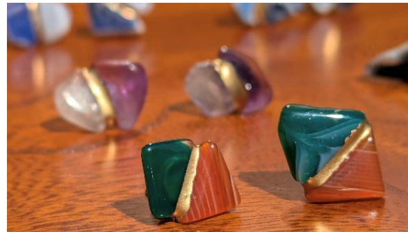
▲箸長 金継ぎアクセサリーイメージ

アーティストとともに作品づくりを楽しむプログラムをはじめ、金継ぎにチャレンジできるアクセサリーづくり、香袋の調香体験、カレー・チャイ講座など、幅広いラインナップをご用意。期間中は、お子さまと参加できるプログラムも含め、約20種類100講座を超えるワークショップを開催予定です。