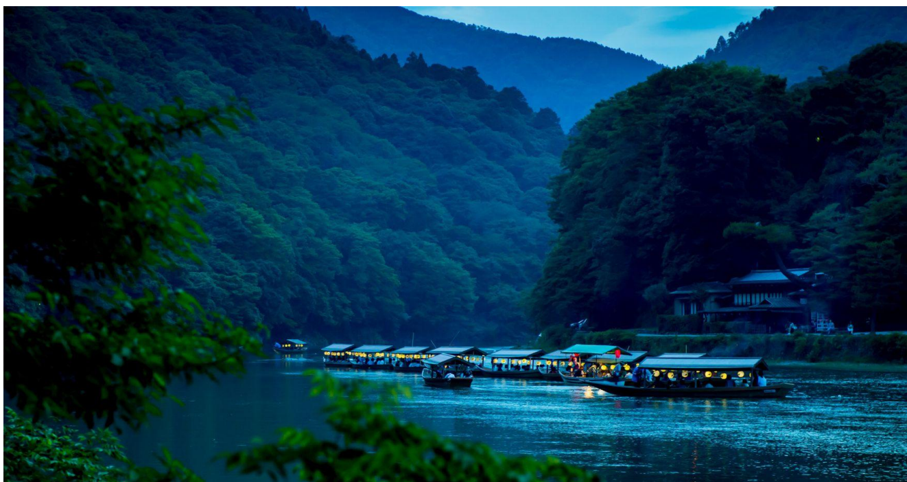
保津川にたゆたう鵜飼船イメージ

「翠嵐ラグジュアリーコレクションホテル 京都」(所在地:京都市右京区・嵐山、総支配人:高木忍)では、2026年7月1日(水)から9月23日(水)まで、千年の歴史を受け継ぐ夏の風物詩「嵐山鵜飼」の鑑賞と、レストラン「京 翠嵐」での旬を味わうディナーを通じて、夏の嵐山ならではの風雅な宵をお愉しみいただける宿泊プラン「篝火(かがりび)」およびレストランプラン「夏篝(なつかがり)」を販売いたします。