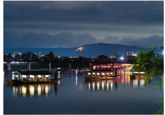
如意ヶ嶽の「大文字」イメージ

乗船日: 2026年8月16日(日) 料金: 1名様 44,734円 (税金・サービス料込) プラン内容: ・翠嵐貸切屋形船での「京都五山送り火」鑑賞 (所要時間約60分、ドリンク付き) ・レストラン「京 翠嵐」にてディナー スケジュール: ディナー: 17:30～ 屋形船乗船: 19:45 大文字点火: 20:00