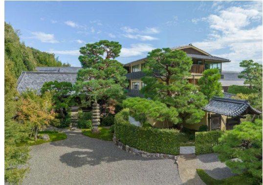
「ホテル外観」イメージ

「翠嵐 ラグジュアリーコレクションホテル 京都」の最新情報はホテル公式ホームページ( www.suihotels.com/suiran-kyoto )にてご覧いただけます。