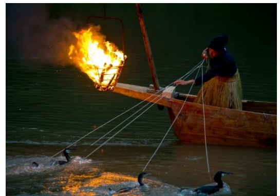
「嵐山鵜飼」イメージ

現在では、鵜飼は毎年7月1日より2か月半行われる、嵐山の夏の風物詩として多くの観光客に親しまれています。夕刻、篝火を灯した2艘の鵜飼舟にそれぞれ烏帽子と腰蓑を纏った鵜匠が乗り、鵜と共に上流より登場、鵜が鮎を捕まえるたびに観客から歓声が上がります。悠久の自然とともに夏の宵を演出します。