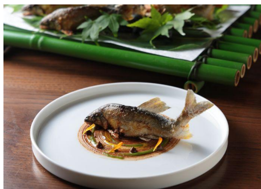
ディナーイメージ