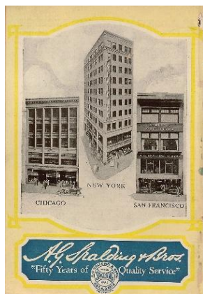
1876年 A.G. Spalding & Bros.開店