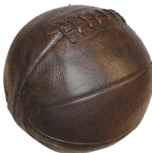
1894年 世界初バスケットボールを開発