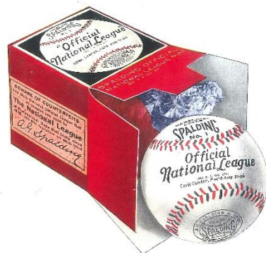
1876年 世界初野球ボールを開発