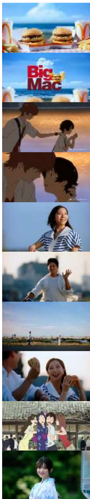
♪「I FEEL COKE」 （歌唱 佐藤竹善）