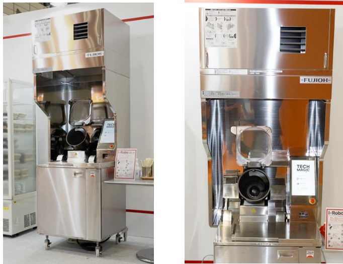
「I-Robo 2」と「クッキングオイルコレクター」のセット使用イメージ

※2 本展示は FUJIOH ブース(4-C12)内で実施します。なお、TechMagic 単独でのブース出展はございません。