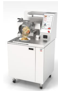
次世代炒め調理ロボット 「I-Robo 2」

・FUJIOH が展開する空気環境改善商品ブランド「QUANTENKI(カンテンキ)※4」製品調理油煙回収ユニット「オイルスマッシャー搭載クッキングオイルコレクター(循環タイプ)」…油をキャッチする「オイルスマッシャー」と、においを捕集するフィルターにより、調理時に発生する汚れた空気をろ過して室内に戻すため、排気ダクトが不要です。これにより工事費用・工期を抑え、空気を外へ排出しないため空調エネルギーの削減※5 やにおいによる近隣トラブルの防止も期待できます。