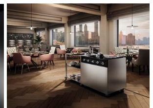
左:循環式 IH 調理ワゴン「アリアシェフプロ」 右:「アリアシェフプロ」使用イメージ

※8 ARIAFINA は、イタリアンデザインのフードを供給するイタリアのエリカ社と富士工業によって 2002 年に誕生したブランドです。イタリアの感性と日本の技術을融合し、一線を画すイタリアンデザインを製品に取り入れています。