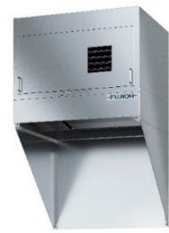
調理油煙回収ユニット 「オイルスマッシャー搭載 クッキングオイルコレクター(循環タイプ)」

製品詳細： https://pro.fujioh.com/chubokankyō/products/cookingoilcollector/