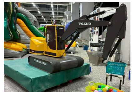
ミニチュアショベルカー (イメージ)

「三浦・三崎おもひで券」1枚につき, 1組(4名さままで)でご利用いただけます。