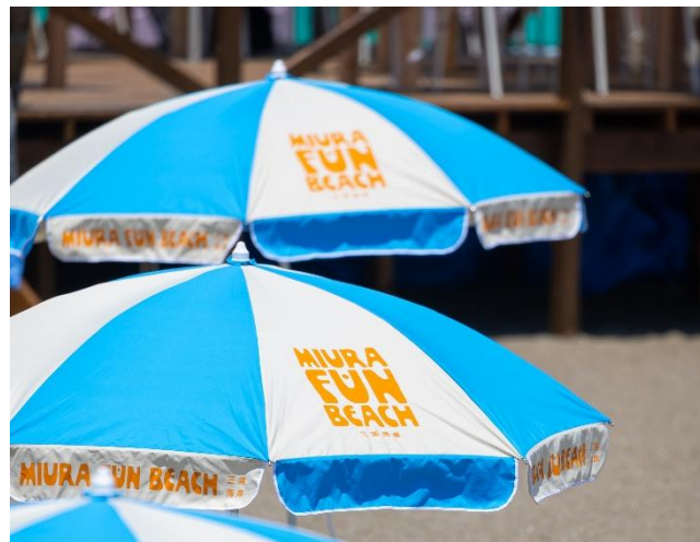
「昨年の「MIURA FUN BEACH 三浦海岸」の様子」