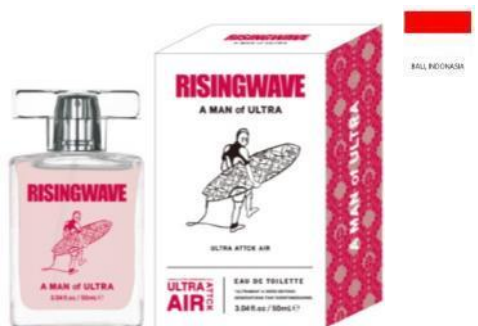
A MAN of ULTRA EAU DE TOILETTE (ウルトラ アタック エアー)

TOP : カシス、アップル、パイナップル、レモン MIDDLE : ジャスミン、ピーチ、ラフランス LAST : ムスク、アンバー、サンダルウッド