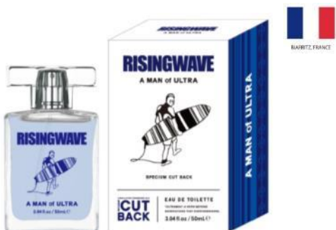
A MAN of ULTRA EAU DE TOILETTE (スペシウム カット バック)

TOP : グレープフルーツ、シトラスゼスト、 リーフィーグリーン、カシス MIDDLE : ミュゲ、フローラルブーケ LAST : セダーウッド、ムスク