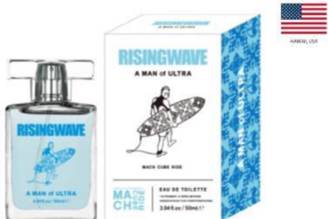
A MAN of ULTRA EAU DE TOILETTE (マッハ チューブ ライド)

ウルトラな海男のウルトラなサーフトリップ。ボード 1 枚で、世界中のどこまでも。 世界有数のサーフスポットでテイクオフ。