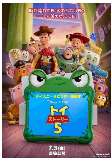
▲ディズニー&ピクサー映画最新作『トイ・ストーリー5』

また、同じく日比谷ステップ広場では約100席の屋外ダイナー「HIBIYA SUMMER DINER」も開催。自家製コントロールティーヤを使った本格タコスと、スパイシーでスモーキーな自家製パストラミを主役に据えたサンドイッチのブースが出店。生ビールやハイボール、見た目も華やかなフローズンカクテルとともに、友人・家族と日比谷の夏夜をお楽しみください。