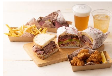
▲HIBIYA SUMMER DINER メニュー画像（右上・右下）