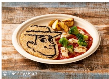
▲「トイ・ストーリー5」カフェスタンド メニュー画像（中央上・中央下）