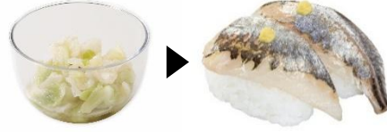
キャベツ酢漬け ▶ あじ 酢 × 良質たんぱく質 夏にオススメ! 栄養を美味しくプラス