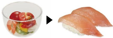
夏野菜サラダ ▶ ピントロ ビタミン C × ビタミン D カラダの根幹から元気を支える