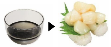
黒ごま豆乳ぷりん ▶ 大盛り貝柱 セサミン × たんぱく質・亜鉛 大人の美しさをサポート