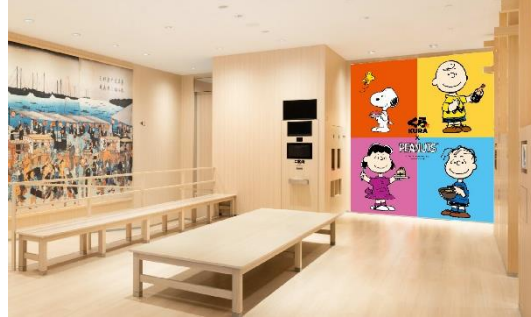
《グローバル旗艦店 なんばパークスサウス》