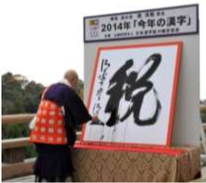
昨年は167,613票の応募の中から、8,679票を集めた「税」が1位に。

公益財団法人 日本漢字能力検定協会(本部:京都市下京区/理事長:久保浩史)が実施する、今年一年の世相を漢字一字で表現する「今年の漢字」は、2015年11月1日(日)から12月8日(火)までの期間、全国より広く募集いたします。全国の書店や図書館に設置する応募箱、はがき、ウェブからどなたでも応募可能です。