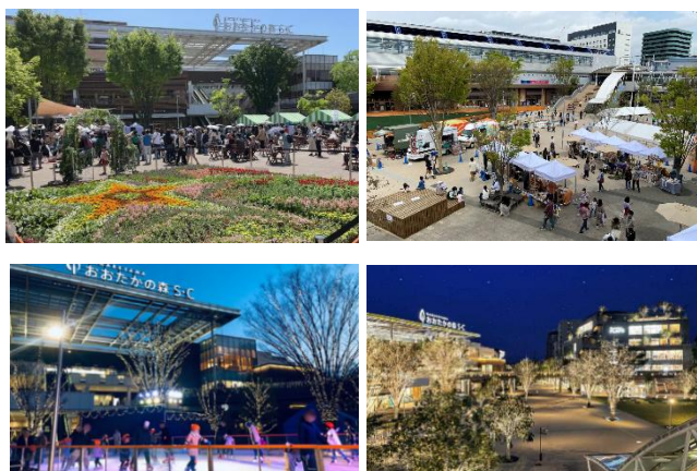
イベント開催時の様子