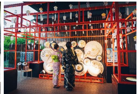
「くらげと傘と風鈴と」ライトアップ