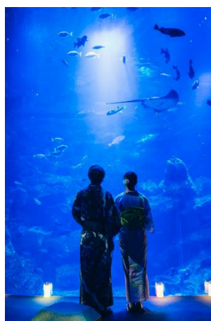
「京の海」大水槽（東の界）