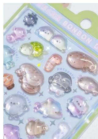
京都水族館ボンボンドロップシール

本チケットは、通常営業時間（平日は午後6時、土日祝日は午後7時まで）終了後に入場できる特別プランです。7月5日（日）・11日（土）・12日（日）・17日（金）・19日（日）・20日（月・祝）の計6日間限定で、午後8時30分まで館内をお楽しみいただけます。