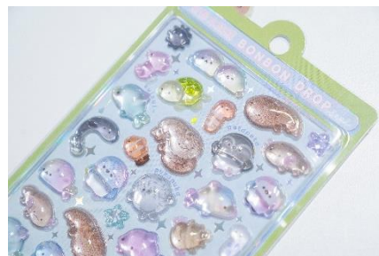
京都水族館ボンボンドロップシール

大人気商品で完売となっていたボンボンドロップシールをこの機会にぜひお買い求めください。