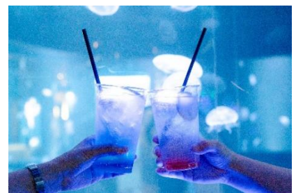
「光る☆クラゲサワー」(アルコール)

販売価格：光る☆クラゲソーダ (ソフトドリンク) 880 円 (税込み) 光る☆クラゲサワー (アルコール) 1,080 円 (税込み)