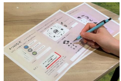
「夜のいきもの謎解きゲーム」(イメージ)