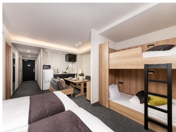
MIMARU 東京 銀座 EAST 外観 / MIMARU 東京 銀座 EAST 客室