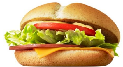
ハムレタスバーガー

「おてごろマック」は、今回新登場の200円のバーガーメニュー、150円のサイドメニュー、100円のデザート・ドリンクメニューをラインナップにそろえ、お客様のご予算とニーズに合わせてお楽しみいただけます。