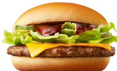
バーベキューポークバーガー