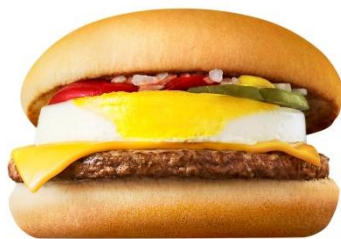
エッグチーズバーガー

おてごろ感がありながら、満足できるお食事のチョイスやバリエーションへのお客様のご期待は非常に高いものがございます。そこで、マクドナルドは近年変更していなかった、おてごろな価格帯の商品構成を強化し、「おてごろマック」として新しく導入します。200円でボリューム感のあるバーガーメニュー「エッグチーズバーガー(ニックネーム:エグチ)」、「バーベキューポークバーガー(同:バベポ)」、「ハムレタスバーガー(同:ハムタス)」を発売します。レギュラーメニューを3商品、同時に登場させるのは日本マクドナルドとしても初めてのことです。