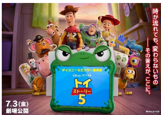
▲ディズニー＆ピクサー映画最新作『トイ・ストーリー5』

なお、今年の夏は三井不動産グループの都内4施設（東京ミッドタウン、東京ミッドタウン日比谷、東京ミッドタウン八重洲、日本橋エリア）で夏のイベントを展開いたします。各施設の個性を活かした夏の楽しみ方をぜひお楽しみください。