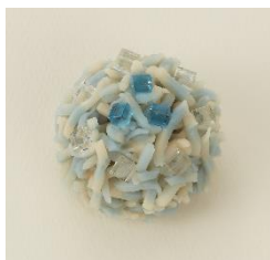
『波』きんとん製 御膳餡入