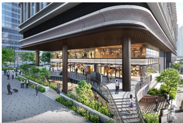
サンクンガーデンに面した商業施設（イメージ）

フラワーロード沿道に面した地上1・2階、さんちかや地下鉄海岸線三宮・花時計前駅とつながる地下1階を含む3フロアに、地域の魅力を発信するなど個性あるさまざまな飲食・物販・サービス店舗を配置するとともに、地上と地下をつなげる開放的なサンクンガーデンを整備することで、神戸のまちの回遊促進および賑わい創出を図ります。