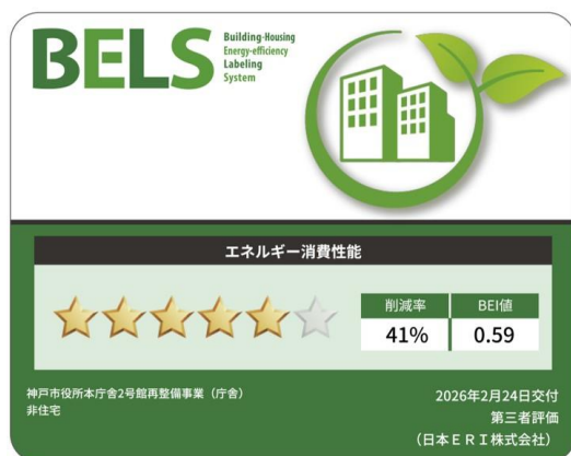
市庁舎部分：BELS 認証 ZEB-Oriented 相当

防災面では、中間階免震構造を採用することで地震時の安全性向上を図るとともに、浸水対策として電気室や機械室、防災センターなどの重要設備室を上層部に配置するなど、災害時のリスク低減を図ります。あわせて、民間エリアの一部を一時滞在施設として開放することを想定するなど、帰宅困難時対策の役割も担います。