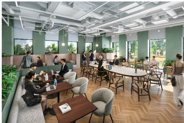
9階オフィスワーカー専用ラウンジ（イメージ）

神戸市内で最大級の1フロアあたりの貸付面積が約500坪（約1,680㎡）となるハイグレードなオフィスを整備します。1フロアの一体利用から最小約45坪（約150㎡）の分割利用まで、企業の進出ニーズに応じてフレキシブルにご利用いただけます。また、9階の屋上庭園に面して、気分転換やサードプレイスなどさまざまなシーンで利用できるオフィスワーカー専用ラウンジを整備し、オフィスワーカーのサポートと企業間交流の促進を図ります。