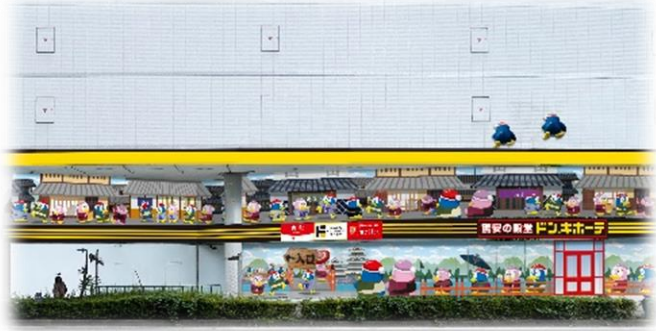
▲国宝・松本城側 北出入口

松本駅周辺から国宝・松本城へと続くエリアは、中心市街地としての側面と、歴史・文化が息づく観光地としての側面を合わせ持ち、地域住民と観光客が行き交う地域です。松本駅と松本城のおよそ中間地点に位置する松本店は、この優れた立地を最大限に活かし“地域密着”“観光”“トレンド”の3つの要素を融合させたハイブリッド型店舗です。国内外から訪れる多くのお客さまをお迎えし、街全体の賑わい創出と地域経済の活性化に貢献することを目指します。