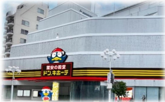
▲JR松本駅側 南出入口

株式会社ドン・キホーテ(本社:東京都、代表取締役社長:鈴木康介)は、2026年6月30日(火)、複合商業施設「松本シェーナ」(長野県松本市)内の1・2階に、「ドン・キホーテ松本店」をオープンします。