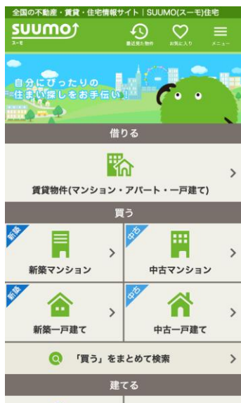
リニューアル後の サイトトップ