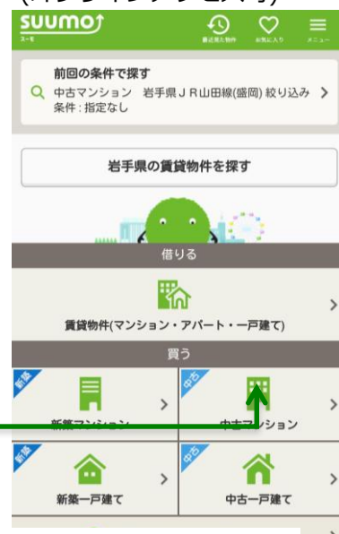
②ホームスクリーンから SUUMOを立ち上げる

リクルート住まいカンパニーはこれからも、ひとりひとりにあった「まだ、ここにはない、出会い。」を届けていきます