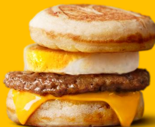
マックグリドル® ソーセージエッグ

メイプル風シロップ入りのパンケーキとソーセージパティ、たまご、チーズとの相性がクセになるマクドナルドのパンケーキサンド。