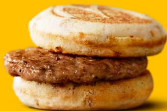
マックグリドル® ソーセージ

朝食にパンケーキサンドという新しい朝食スタイルの提案です。メイプル風シロップ入りのパンケーキとソーセージは相性抜群。